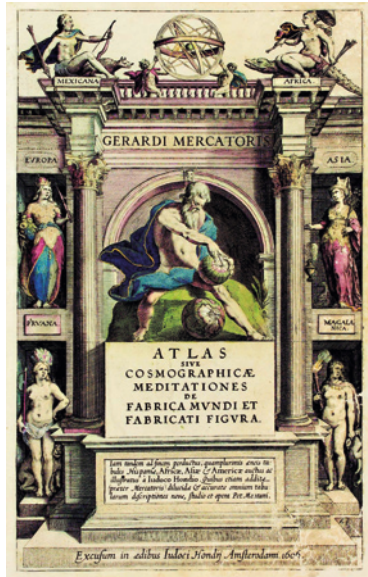
Titelblatt des Mercator-Hondius Atlases mit allegorischen Darstellungen der Erdteile, 1606

Der große Plan Gerhard Mercators war es, die gesamte Welt in Karten und Erläuterungen in einem Buch, seinem „Atlas“, darzustellen. Er arbeitete Jahrzehnte lang an diesem Projekt und verkaufte seit 1585 bereits Teil-editionen, erlebte jedoch die Herausgabe des Gesamtwerkes nicht mehr.