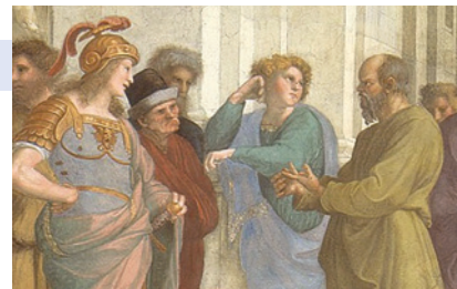
Foto: Raffael, Die Schule von Athen (Ausschnitt), 1510/11. Vatikan, Stanza della Segnatura.

Die große Frage, die der Vortrag aufgreift und zu beantworten versucht, lautet: Wie kam es, daß das kleine Europa, genauer: dessen westlicher Teil und dann das von Europa geprägte Amerika, bis ins 20. Jahrhundert die in wissenschaftlicher und technischer Hinsicht bei weitem erfolgreichste Region der Welt war, während die bis ins 12. Jahrhundert führenden islamischen Länder und China Niedergang erlebten? Es wird nicht darum gehen, allein eine Triumphgeschichte zu erzählen; die dunkle Seite des „Aufstiegs Europas“ wird nicht ausgeblendet werden. Nicht zuletzt die Europäerinnen und Europäer selbst hatten teuer dafür zu bezahlen. Vergleiche sollen zeigen, welche Voraussetzungen für die Karriere des Kontinents wichtig, vielleicht entscheidend waren. Dazu zählten seine politische und kulturelle Vielfalt, Freiheiten und die Existenz von Mittelschichten, die Eindämmung der Macht der Religion und das antike Erbe mit seinem kritischen Geist. Entscheidend war die Offenheit Europas für Kulturtransfers: die Bereitschaft, vom Fremden zu lernen. Ein Ausblick wird sich mit der Frage beschäftigen, ob das europäisch-amerikanische Zeitalter inzwischen seinem Ende entgegengeht und die Zukunft China und anderen Ländern Asiens gehören könnte.