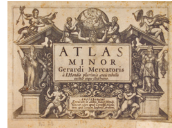
Titelblatt eines „Atlas Minor Gerardi Mercatoris“

Auch mit einem neuen Format hatte Hondius großen Erfolg: Sein „Atlas Minor Gerardi Mercatoris“ hatte nur ein Drittel der Größe der Normalausgabe, war preiswerter und z. B. auf Reisen viel handlicher. Er enthielt neu gestochene Karten und verkürzte Texte. Hondius nutzte die hohe Bekanntheit, die mit dem Begriff Atlas und dem Namen Mercator verbunden waren.